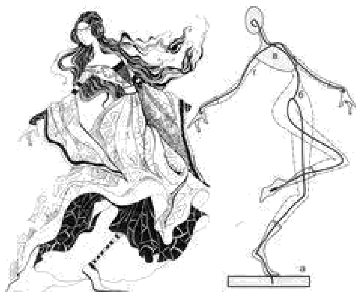
Додаток В.1. «Замальовки людини»