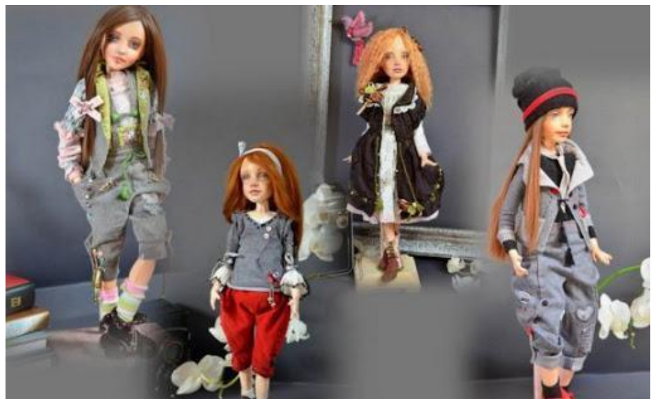
Додаток Б.4. «Авторська лялька в сучасному стилі»