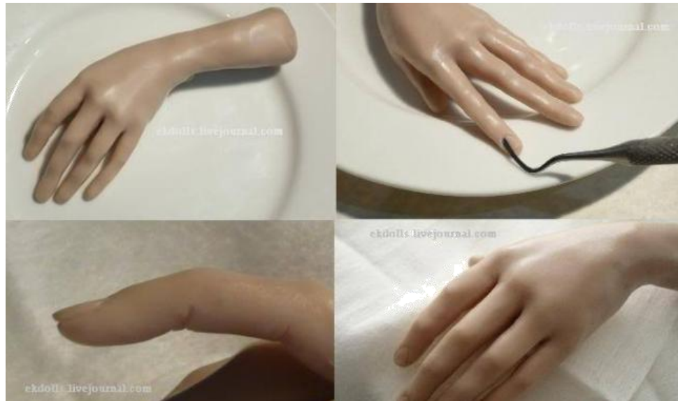
Додаток Б.2. «Виготовлення руки ляльки»