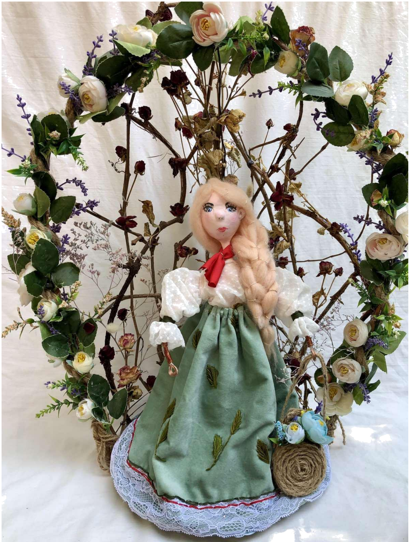
Додаток А.1. «Авторська лялька»